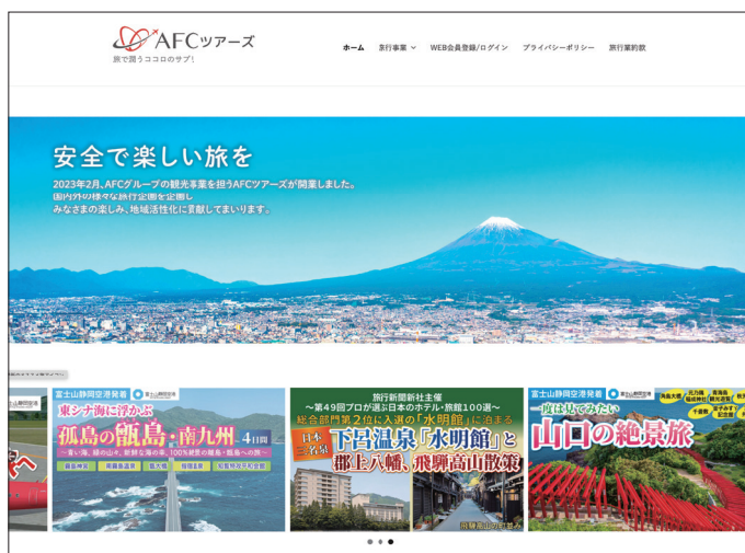
サイトトップページ