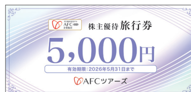
株主優待旅行券・表