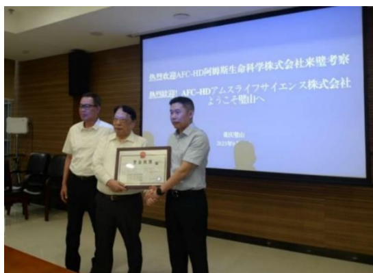
璧山区長より営業許可証授与