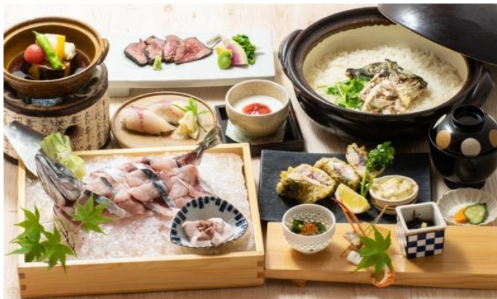
三保松さばの三保会席