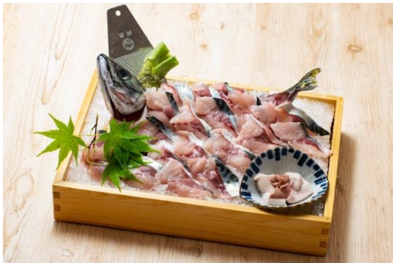
三保松さば 姿づくり