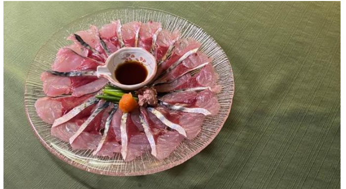
三保松さば さばポン酢