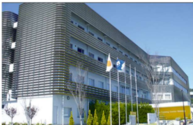
清水ナショナルトレーニングセンター外観

今後も地域に根差した公共施設において、施設の価値向上に寄与するレストラン運営を推進してまいります。