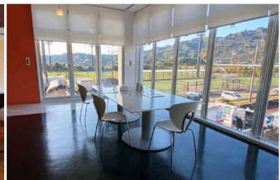
レストラン「s.colina(エス・コリーナ)」内観

＜本件リリースに関するお問い合わせ＞ 株式会社なすび 経営管理部 TEL：054-347-7888